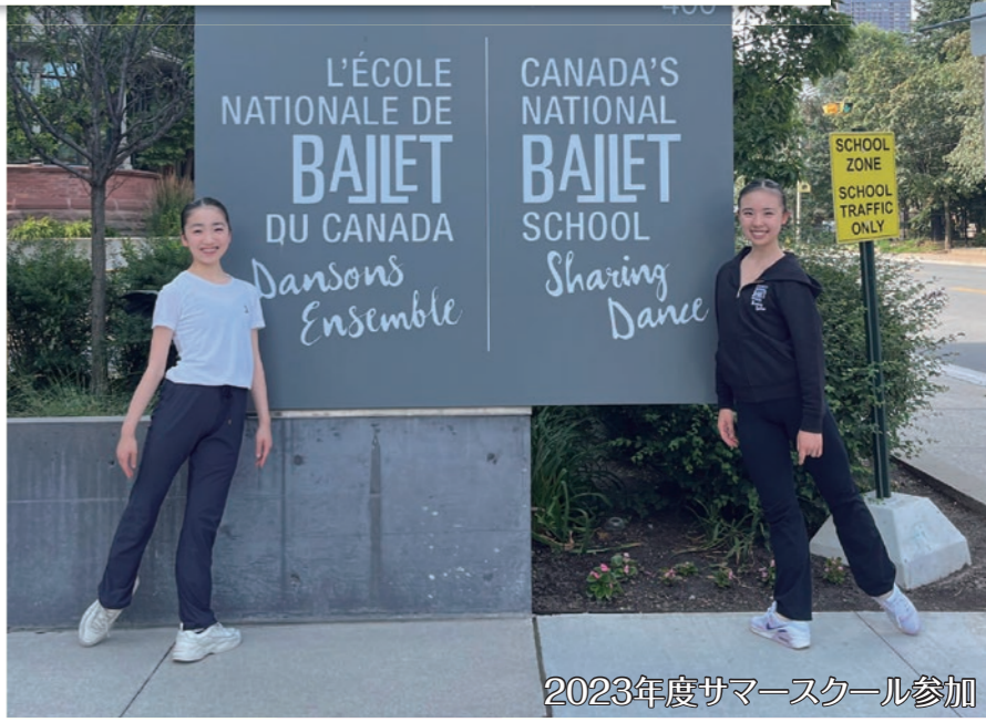
2023年度サマースクール参加

このオーディションは2025年9月入学を希望される方を対象としたオーディションです。オーディション合格者は2025年夏に現地で行われるサマースクールに参加することができます。